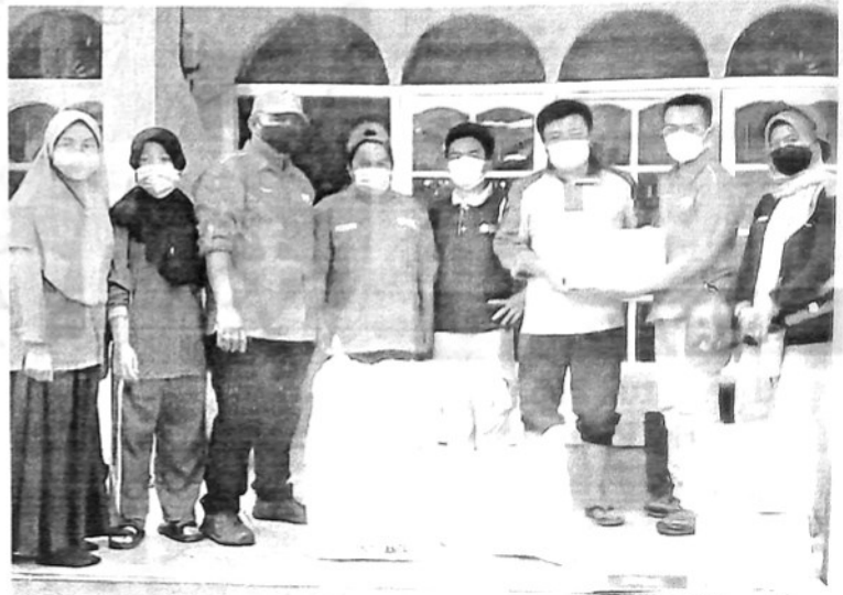
PMI Padangpanjang salurkan bantuan untuk korban gempa di Pasaman dan Pasaman Barat.

"Semoga apa yang kita perbuat dan donasi kan bermanfaat bagi saudara kita yang terdampak bencana, serta bernilai ibadah di sisi Allah