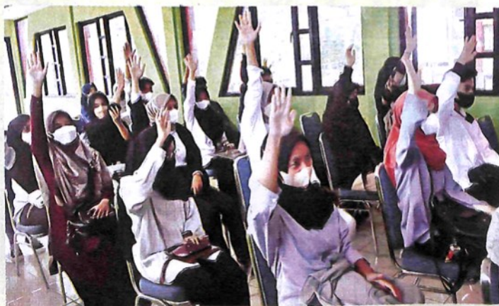
PENCARI Kerja mengikuti Seleksi Pelatihan Bahasa Jepang, Senin (7/3) di Aula Senja Kenangan, Kelurahan Bukit Surungan, Kecamatan Padangpanjang Barat.

Adapun penempatan kerja di Jepang, sebut Nofial, menyesuaikan dengan jurusan yang diambil. "Ada 16 bidang kerja. Perusahaan tersebar di seluruh Jepang," ujarnya. (mas)