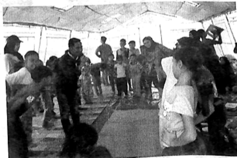
TRAUMA HEALING - Forum GenRe Padang Panjang berikan trauma healing untuk korban gempa Pasaman. (ist)

Jhoni berharap para korban bencana gempa ini cepat pulih dan bisa beraktifitas seperti biasa kembali. "Yang harus dibantu bukan hanya kebutuhan materi, tetapi juga trauma mereka atas musibah itu," ujarnya. (205)