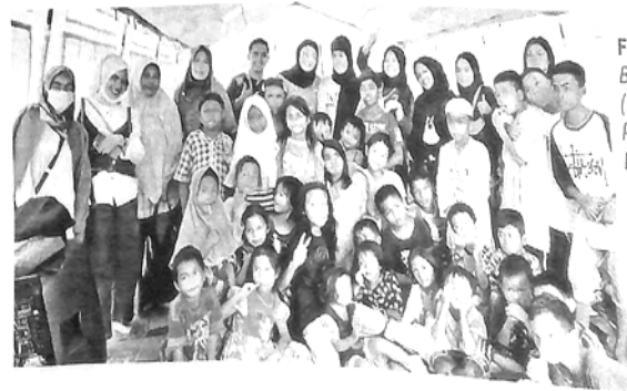
FORUM Generasi Berencana (GenRe) Kota Padangpanjang berfoto bersama saat memberikan trauma healing kepada anak-anak korban gempa di Kecamatan Tigo Nagari, Kabupaten Pasaman.