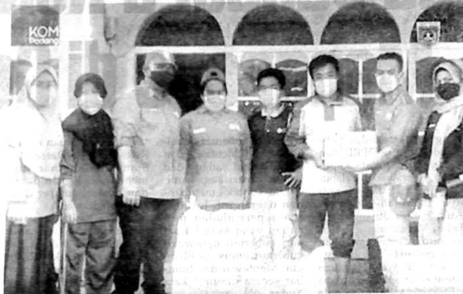
SERAHKAN BANTUAN —Tim PMI Kota Padangpanjang serahkan bantuan korban gempa.

"Donasi berupa uang, kemudian digunakan untuk menyediakan perlengkapan individu yang dibutuhkan pengungsi, berdasarkan hasil koordinasi dengan posko PMI tujuan distribusi. Perlengkapan individu tersebut berupa, selimut, popok bayi, popok dewasa dan lansia," ungkap Datuak Novi (sapaan akrabnya -red) kepada kominfo, Senin (7/3).